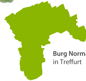
Burg Normannstein in Treffurt