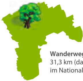
Wanderweg Rennstieg 31,3 km (davon 8,5 km im Nationalpark Hainich)

Der Rennstieg ist ein alter Eilbotenweg, der zwischen Eigenrieden und Behringen von Norden nach Süden über den Kamm des Hainich verläuft. Dem Wanderer eröffnen sich Fernblicke zu den Fahner Höhen zur einen Seite und zum Thüringer Wald mit der Wartburg zur anderen.