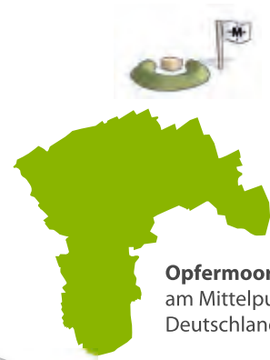
Opfermoor am Mittelpunkt Deutschlands

An dieser bedeutenden germanischen Kultstätte findet man originalgetreue Rekonstruktionen von Opferstätten und einem Germanendorf aus dem 3. Jahrhundert.