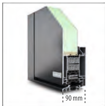
DS 90 mit 90 mm Bautiefe statt DS 75 mit 75 mm