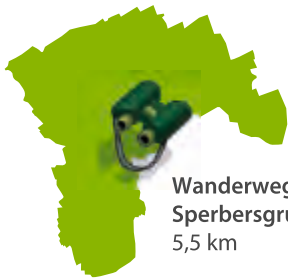
Wanderweg Sperbersgrund 5,5 km

Am „Wartburgblick“ grüßt die benachbarte Welterbestätte.