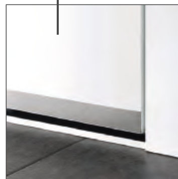
Edelstahl-Designsockel flächenbündig 30 mm, SB 703-1