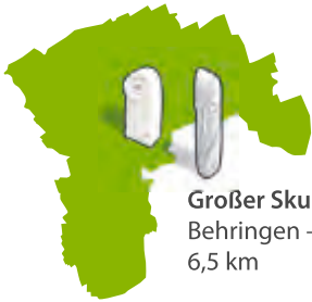
Großer Skulpturenpfad Behringen – Hürtenerode 6,5 km

Im 200 Jahre alten Behringer Schlosspark sowie entlang des Kleinen und Großen Skulpturenpfads können über 80 Skulpturen internationaler Künstler bestaunt werden, die den Landschaftsraum harmonisch in einen Kunstraum verwandeln.