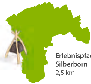
Erlebnispfad Silberborn 2,5 km

Lust auf eine etwas andere Wanderung? Gelegenheit dazu bietet der Erlebnispfad Silberborn. Hier kann der Wanderer sein Wissen über die Nationalpark-Schätze testen. Welchen Charakter haben die verschiedenen Bäume und welcher ist „mein“ Baum?