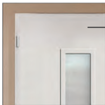
Aufsatzfüllung innen Flügelüberdeckend beidseitig