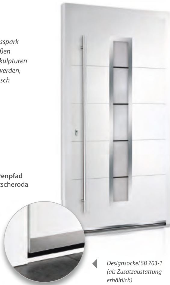
Designsockel SB 703-1 (als Zusatzausstattung erhältlich)