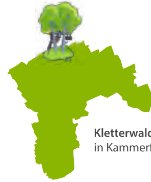
Kletterwald Hainich in Kammerforst

Natur erleben aus anderer Perspektive ist im Kletterwald am Rande des Nationalparks möglich: 120 Kletterelemente in 1 m bis 18 m Höhe auf neun Parcours mit unterschiedlichen Schwierigkeitsgraden können von Kindern und Erwachsenen erobert werden.