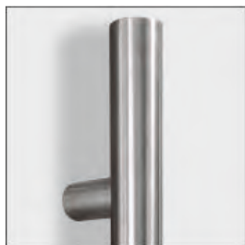
Integrierter Stangengriff 800 mm oder 1200 mm lang