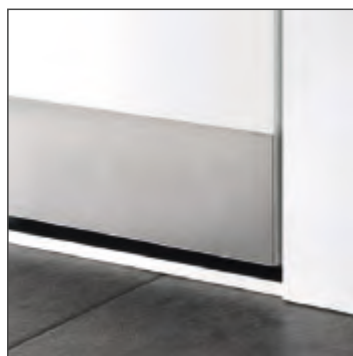
Edelstahl-Designsockel flächenbündig 100 mm, SB 710-9