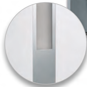
◀ Applikation – Edelstahldesign flächenbündig